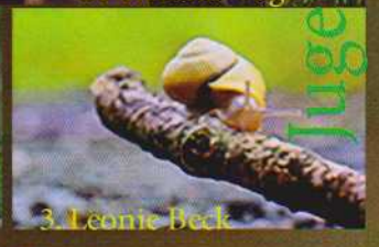
3. Leonie Beck