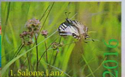
1. Salome Lanz