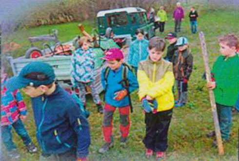
Jugendprojekt des OVS