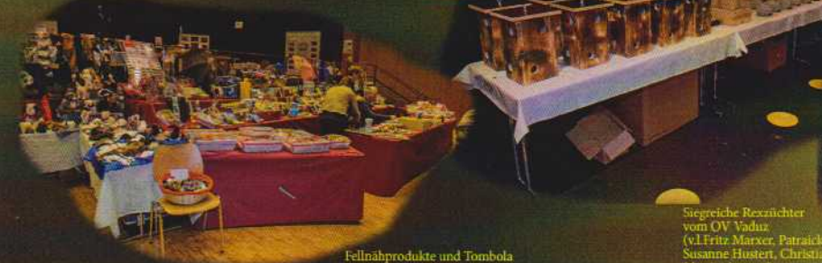
Fellnähpunkte und Tombola