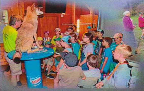
Jugendcamp Mauren 2016