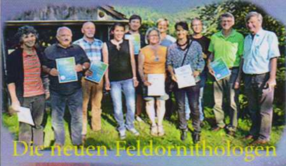
Die neuen Feldornithologen