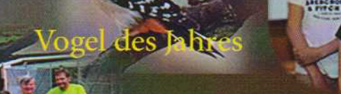
Vogel des Jahres